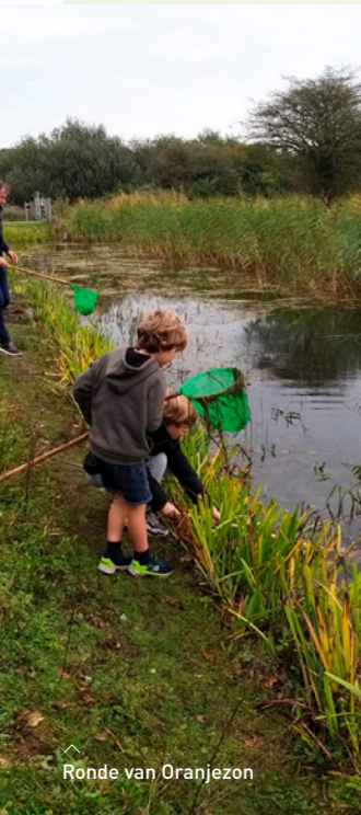
Ronde van Oranjezon

de monitoring ('tellers'): bij het inventariseren van vogels, planten en amfibieën, zoals boomkikkers, weidevogels en duinvegetatie in Oranjezon. Daarnaast werken we samen met organisaties in de geestelijke gezondheidszorg en reclassering voor re-integratie.