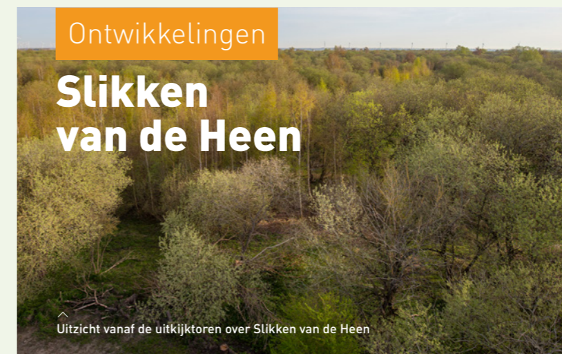
Uitzicht vanaf de uitkijktoren over Slikken van de Heen

De in 2020 geïntroduceerde wisenten zorgen overduidelijk voor meer variatie in de vegetatie en meer dynamiek in het gebied, doordat ze bomen slopen en de bodem omwoelen voor zandbaden. Hun imposante en fotogenieke verschijning trok dit jaar flink meer bezoekers naar het gebied, zowel voor de aangeboden excursies als zelfstandig bezoek. Dankzij een bijdrage van de Nationale Postcode Loterij werd de uitkijktoren in het najaar met 5 meter verhoogd door er een 'onderstel' onder te plaatsen: op maar liefst 25 meter hoogte is weer volop uitzicht over de bomen en het begrazingsgebied heen.