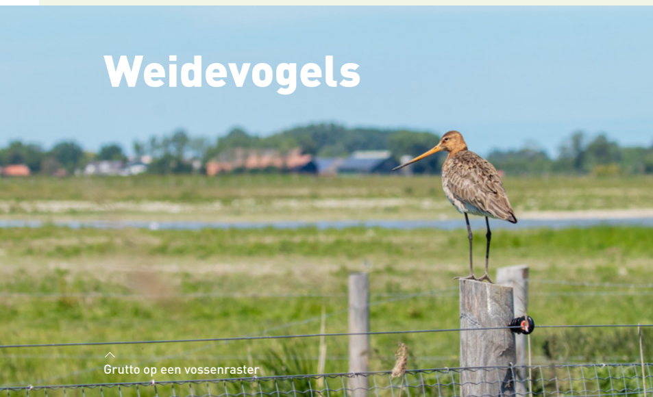
Grutto op een vossenraster

Het Zeeuwse Landschap houdt de vogelstand goed in de gaten. Minimaal om de drie jaar worden broedvogels geteld in onze weidevogelgebieden, op sommige plekken doen we dat vaker. Zo zijn in 2021 de weidevogels geïnventariseerd in de Yerseke Moer en de Sint Laurens Weihoek. In de Weihoek, waar een voswerend raster staat, hadden de kluten een goed jaar en zijn er veel kuikens groot geworden. In de Yerseke Moer leek het aanvankelijk goed te gaan, maar was het broedsucces uiteindelijk toch slecht: veel nesten zijn leeggeroofd door vossen en andere roofdieren. Het gaat helaas dan ook nog altijd niet goed met de weidevogels.