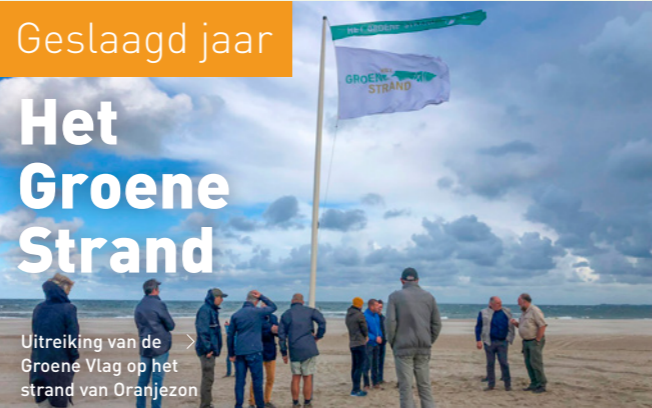
Uitreiking van de Groene Vlag op het strand van Oranjezon

Voor dit landelijke project zijn binnen Zeeland drie strandcommunities opgezet, waar ruim 25 Zeeuwse stakeholders bij betrokken zijn: van gemeenten en natuurorganisaties tot ondernemers. Gezamenlijk zijn 41 opruimacties georganiseerd en werden vier broedeilanden beschermd. Het aantal strandondernemers dat duurzamere, veelal plasticvrije, keuzes maakt, groeit, net zoals het gebruik van aangepaste rijroutes in de buurt van strandbroeders. In september werd aan Oranjezon de eerste Groene Wimpel in Zeeland uitgereikt.