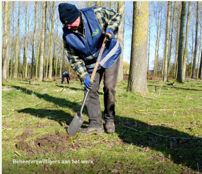
Beheervrijwilligers aan het werk